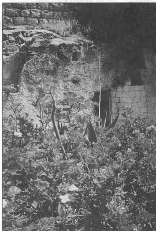
Gravhaven i Jerusalem